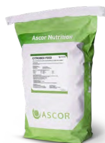
Packaging Sacco da 20 kg